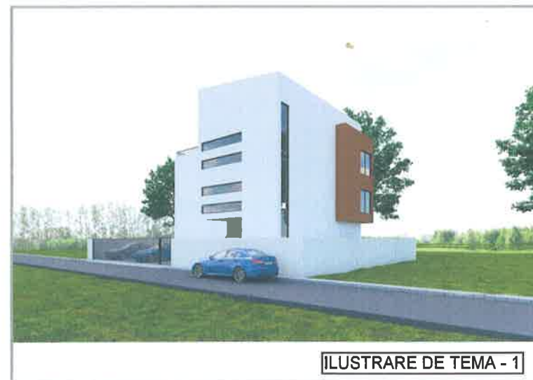
ILUSTRARE DE TEMA - 1