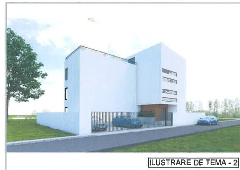
ILUSTRARE DE TEMA - 2